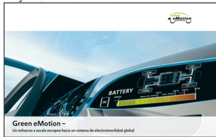
Proyecto Green eMotion