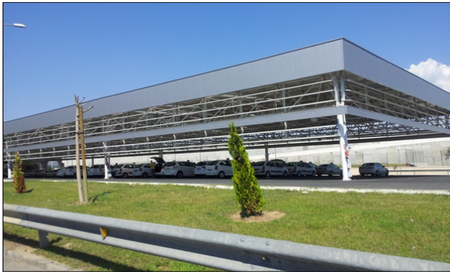
Bolsa de taxis del Aeropuerto de Málaga