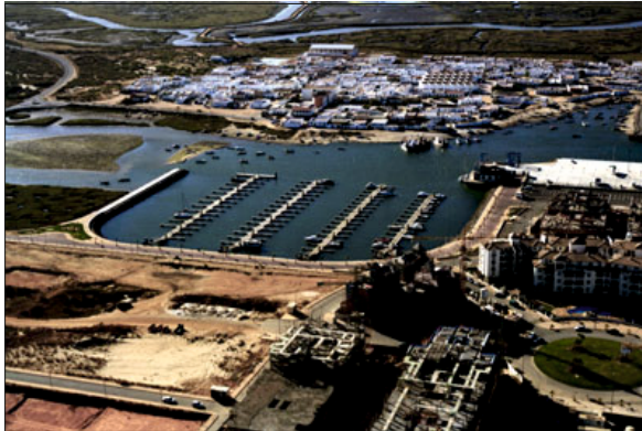
Perspectiva aérea de la zona de actuación