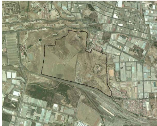
Ortofoto del sector